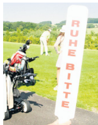
Ohne Worte: Beim Abschlag war volle Konzentration gefragt, die Zuschauer mussten sich zurücknehmen.