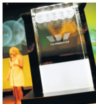
Begehrtes Objekt: Um diesen Preis – hier ausgestellt während der Players Night – ging es bei den Schüco-Open 2010.