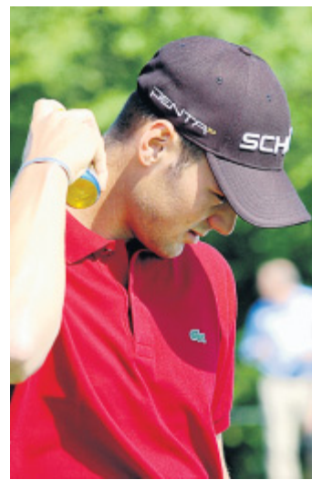
Sonnenschutz: Golfprofi Martin Kaymer kam wie alle anderen Teilnehmer beim Gang über die Anlage ganz schön ins Schwitzen. Gegen die strahlende Sommersonne half Öl in den Nacken.

„Letztes Jahr“, fährt der Steinhagener fort, „bin ich in Bielefeld mit Bernhard Langer mitgelaufen. Das war schon beeindruckend. Vor allem die stoische Ruhe, die er auch bei einem schlechten Schlag hat, wo ich als Anfänger längst nervös werde.“ Er habe erst überlegt, ob er wieder mitgehen solle. „Aber hier“, macht er deutlich, „sehe ich doch auch alles.“