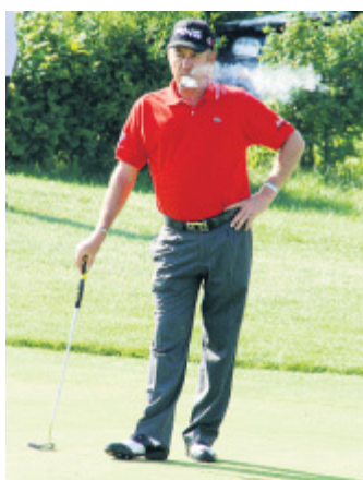
Unter Dampf: Ob auf dem Grün des Haller Golfclubs oder außerhalb – für Miguel Ángel Jiménez war es schwer, sich von seiner geliebten Zigarre zu trennen.